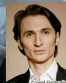
ディヌ・タマズラカル