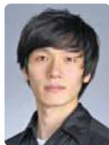
ジークフリード王子 キム・セジョン