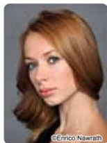
オデット/オディール ヤーナ・サレンコ ベルリン国立バレエ団プリンシパル