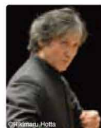
芸術監督 演出・振付 演出(再演) 演出助手 バレエマスター(ゲスト)

指揮：大野和士（東京都交響楽団 音楽監督） 音楽：P. I. チャイコフスキー 演奏：東京都交響楽団